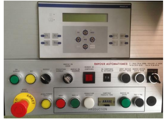
Electrical cabinet / Electrical cupboard